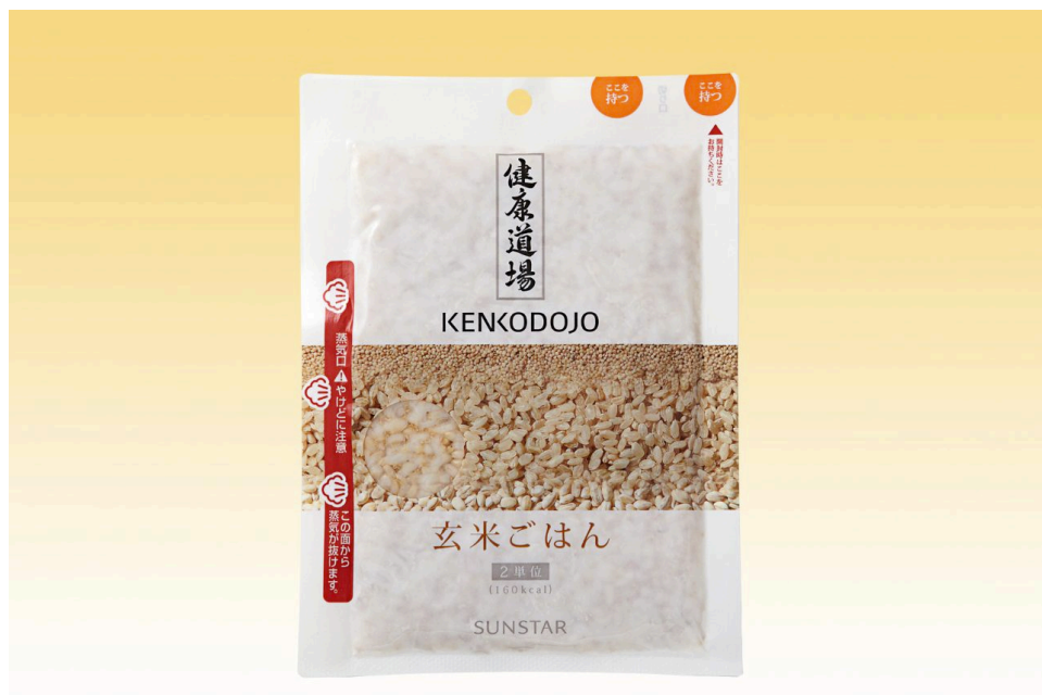
健康道場 玄米ごはん

糖尿病患者の方の声を受けて1食分を2単位(160kcal)とし、糖が気になる方もお使いになりやすいよう工夫しました。