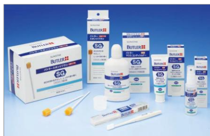
バトラー 口腔ケアシリーズ