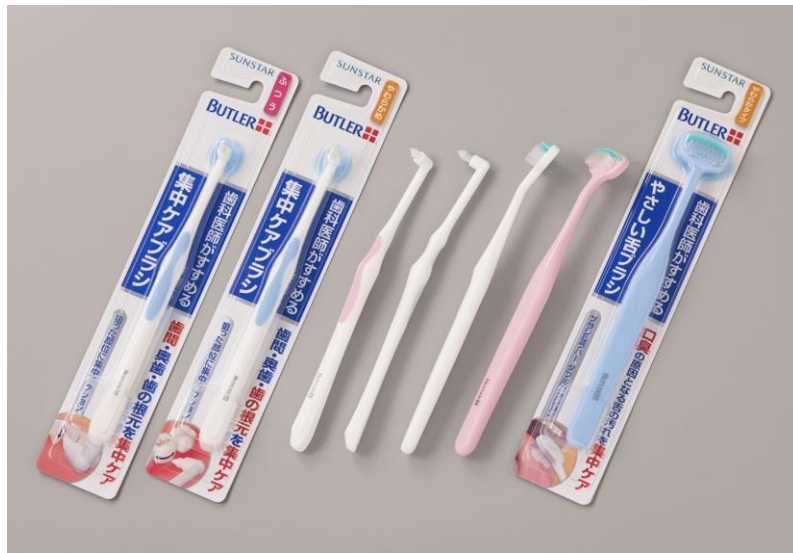
（左）バトラー 集中ケアブラシ ふつう（ブルー）／ やわらかめ（ブルー、ピンク、グレー） （右）バトラー やさしい舌ブラシ（ホワイト、ピンク、ブルー）

サンスター株式会社（本社：大阪府高槻市、代表取締役社長 吉岡貴司、以下サンスター）は、歯科医師がすすめるブラシシリーズとして、普通のハブラシではみがきにくいお口の部位の汚れをきめ細かく効果的に除去する「バトラー 集中ケアブラシ」「バトラー やさしい舌ブラシ」を2014年4月9日（水）より全国で発売いたします。