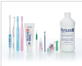
バトラー 歯科医院向け商品

歯科医院などのプロフェッショナル用ハブラシとしてアメリカで誕生。プラーク(歯垢)除去に関する独自の考え方と高品質のツールを長年にわたって提供。来院者一人ひとりの口腔内の状態に合った商品を推奨できるよう商品開発を行っております。現在は、歯科医院向けに多種のハブラシ、歯間清掃具、ハミガキなどのオーラルケア商品を販売しているほか、高齢者やがん患者など、口腔乾燥、口腔粘膜の荒れた方にも使いやすい「バトラー 口腔ケアシリーズ」を歯科医院、病院売店、インターネット通販で販売しています。一般の小売店向けには、今回発売する「バトラー 集中ケアブラシ/やさしい舌ブラシ」の他、「バトラー ミロライト音波振動ハブラシ」を販売しています。