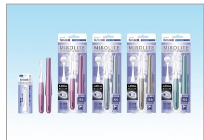
バトラー ミロライト音波振動ハブラシ