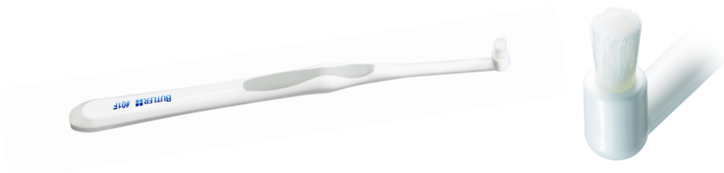
図 5 群 歯頸部、歯肉縁上などのプラークコントロールに最適なフラットカットブラシ

ブラシは歯頸部、歯肉縁上やインプラント埋入部を優しくみがくことができる、フラットカットを採用。円錐形のコーンカットよりもやさしくみがきあげます。(図 5 群)