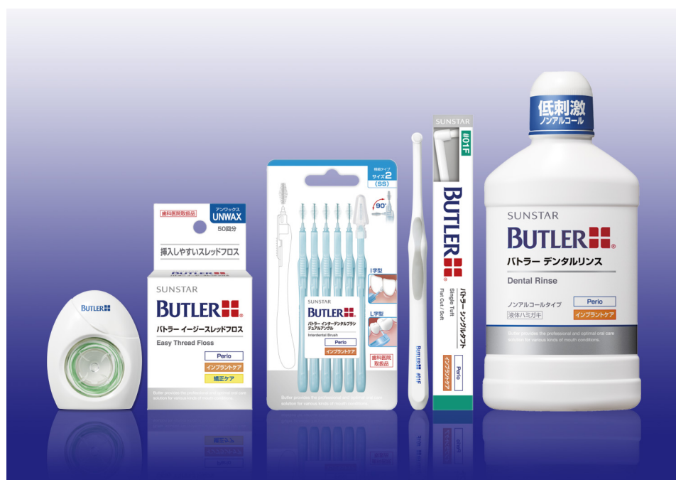
左から、「バトラー イージースレッドフロス」、「バトラー インターデンタルブラシ デュアルアングル」、 「バトラー シングルタフト#01F」、「バトラー デンタルリンス」

サンスターでは、インプラント埋入以降のメンテナンス商品を提供することで、今後増加するインプラントを装着される方のインプラント生存率を高めることに貢献してまいります。