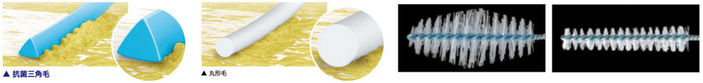
図 2 群 断面に角がある三角毛で歯間のプラークを削ぎ落とす 図 3 群 左:バレル(樽)型(SS・S・M)・右:テーパー型(SSS)