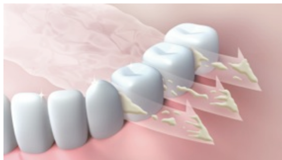
図1 歯垢のもとなどの汚れをやわらかくし、浮かせて洗い流します。