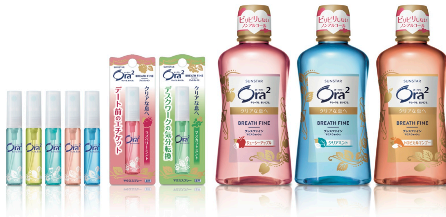
オーラツー ブレスファイン マウススプレー（左） オーラツー ブレスファイン マウスウォッシュ（右）

「息のメイク直し」アイテムとしてより女性が手に取りやすい新パッケージで、2015年3月9日（月）より全国で発売いたします。