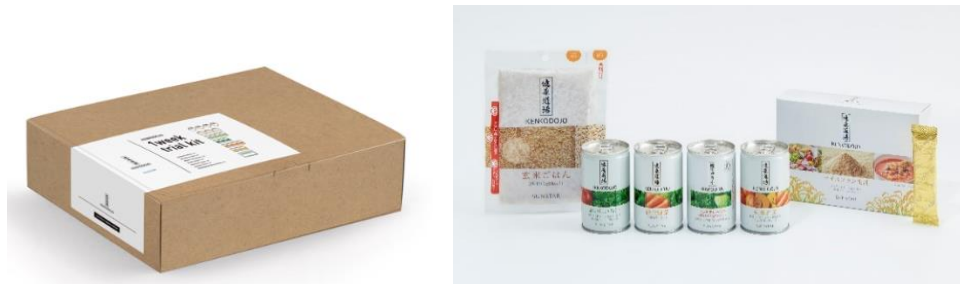
左:健康道場 1 週間体験キット専用 BOX、右:キット内容イメージ

【販売概要】 健康道場「1週間体験キット」販売ページ: https://www.sunstar-shop.jp/s/g01057/ サンスターオンラインショップ: https://www.sunstar-shop.jp/s/