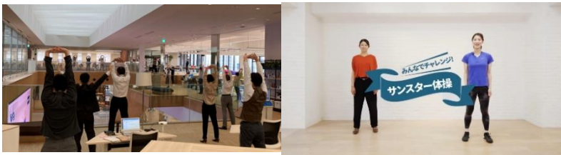
サンスター体操をする従業員の様子

労災、主に転倒事故防止のため、2021年9月には、株式会社ルネサンスにご協力いただき、足腰の強化に重点をおいた「サンスター体操」を開発しました。年齢も体力も違う全ての方々が「安全に」「楽しく」「効果的」に体操を行うことができなければならないと考え、自分で体操レベルを選択できるように通常レベルの「スポーツスタイル」と、やさしいレベルの「オフィススタイル」2種類の負荷レベルを用意しています。毎朝決まった時間に事業所内だけでなく、オンラインでも動画を流すことで、テレワーク勤務者も自宅で実施できるようになっています。サンスター体操導入後は、転倒災害は減少傾向にあり、2023年では1件となりました(図1)。