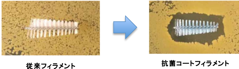
図3：抗菌コートフィラメントを採用。使用後の歯間ブラシを清潔に保ちます。