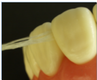
図1：フラットタイプは断面が平らで歯間に挿入しやすい。