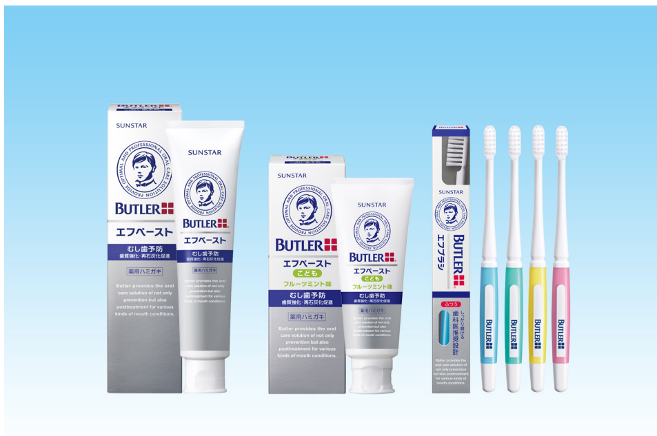
バトラー エフペースト<左>