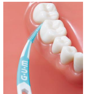
奥歯にも届きやすいカーブ型ハンドル