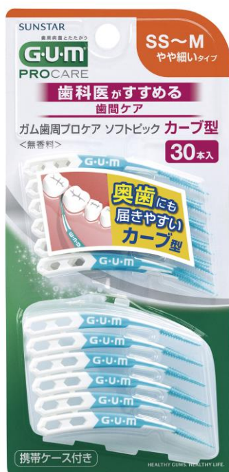
ガム歯周プロケア ソフトピックカーブ型 30P サイズ SS~M