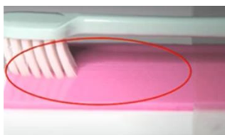
(新製品: 寒天に傷なし)