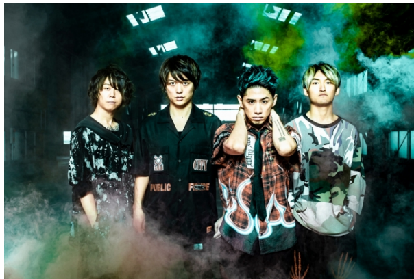
ONE OK ROCK