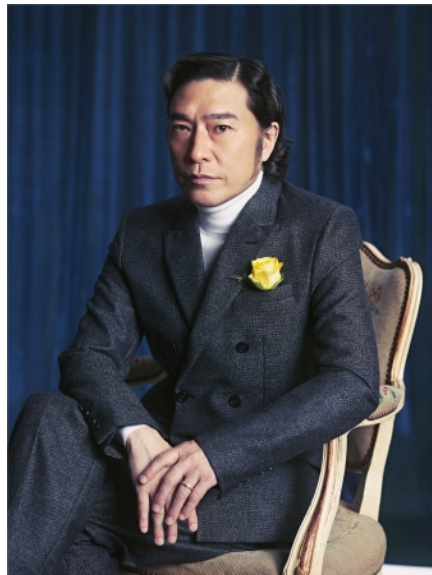
トータス松本 (ウルフルズ)