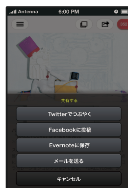
▲SNS やクラウドと連携