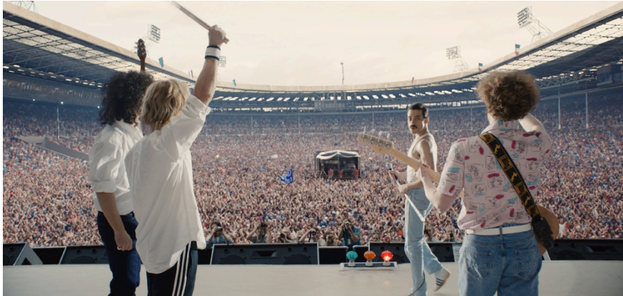
映画『ボヘミアン・ラプソディ』イメージ

トークイベントを試写会当日に開催します。クイーンや音楽にまつわるトークをお楽しみいただけます。当日の様子は、後日 J-WAVE でもオンエアされます。