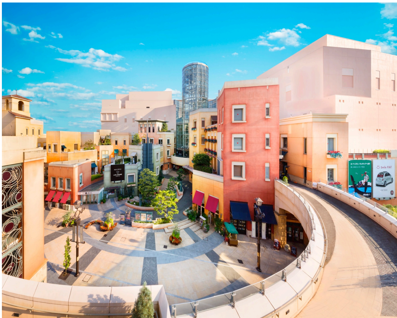
「チネチッタ」のある「ラ チッタデッラ」外観

JR川崎駅から徒歩5分のイタリアのヒルタウンをモチーフとした商業施設「ラ チッタデッラ」内にある、日本初のシネマコンプレックス。高級感あふれる快適な劇場空間には、オペラ座にも納入実績のある仏・キネット社の特注シートがスタジアム方式に並び、どのシートからも視界良好です。ヘッドレスト付き特注ハイバックシートを採用し、ゆったりサイズが特徴。全身を包み込むような心地よさで、長時間座っても疲れを感じさせません。巨大スクリーンで観る映像と、スクリーン裏や四方の壁に張り巡らされたサラウンドスピーカーから流れるサウンドは、迫力満点です。