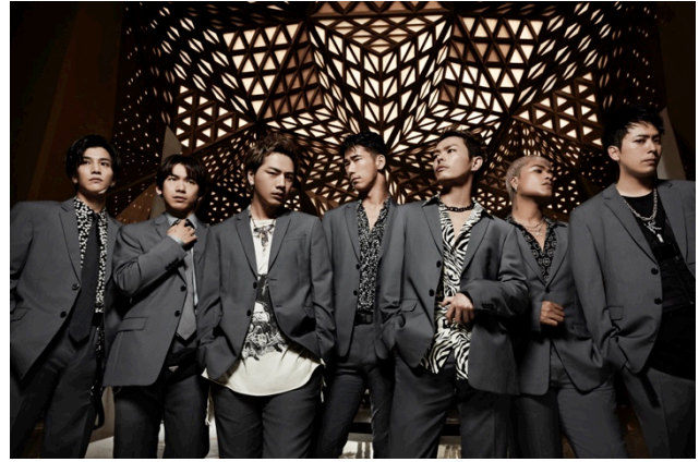
三代目 J SOUL BROTHERS from EXILE TRIBE