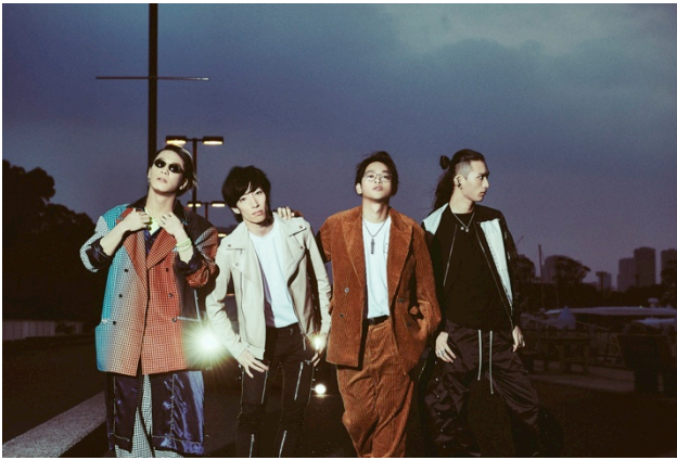
THE ORAL CIGARETTES