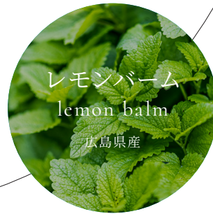
レモンバーム lemon balm