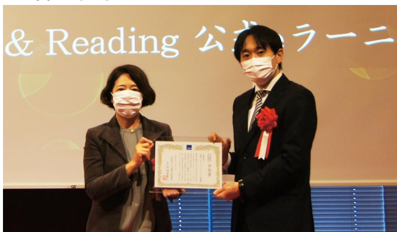
※写真は、2021年11月11日に行われた授賞式の様子です。

「TOEIC Listening & Reading 公式 eラーニング」は、実践的な英語学習ツールとして、電子環境を生かした機能により、英語学習者それぞれに最適化された学びを提供し、学習者の英語力向上に寄与している点が高く評価され、「日本電子出版協会会長賞」を受賞いたしました。