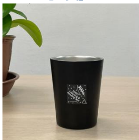
300 回記念 オリジナルタンブラー 各回 30 名