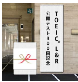
300 回記念 会場看板風オリジナルタオル 各回 135 名