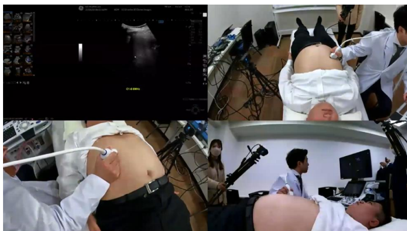
配信映像（受講者側）