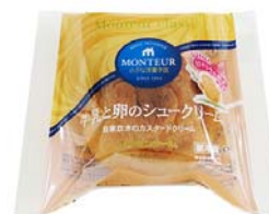
牛乳と卵のシュークリーム