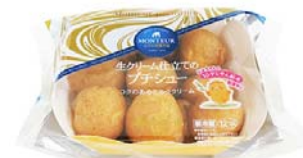
生クリーム仕立てのプチシュー

※1 AR="Augmented Reality (拡張現実) 技術"とは、現実の環境から知覚に与えられる情報に、コンピュータが作り出した情報を重ね合わせ、補足的な情報を与える技術です。例えば、カメラを通してディスプレイに映し出される「現実」のビジュアルに、テキストや画像、3Dオブジェクトなど、さまざまな情報を重ね合わせて表示するといった拡張処理が可能です。