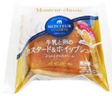
牛乳と卵のカスタード&ホイップシュー