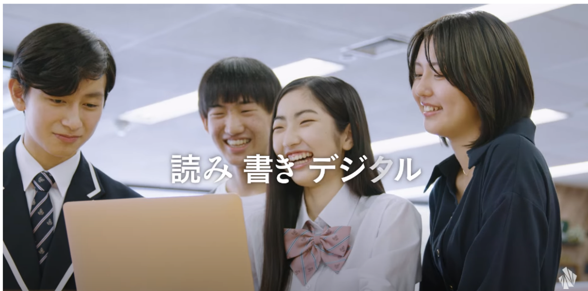
図1の男女13-49歳でのランキング1位は、角川ドワンゴ学園の『N高等学校「読み書きデジタル」篇』でした。全国一斉配信のテレビCMを放映するのは初めての試みとなったCMです。CMには現役のN高、S高の生徒が出演し、リアルなキャンパスライフを紹介しています。その後、YouTuberとしても活躍する西村博之さんのコメントがあり、最後に「読み書きデジタル」という新しいキャッチフレーズが流れます。