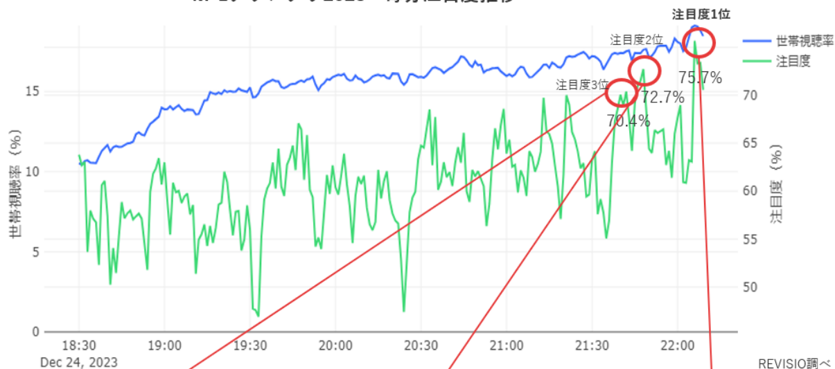
M-1グランプリ2023 毎分注目度推移

21:40～42 優勝した令和ロマンのネタが始まって、1分30秒後くらいのシーン。度々笑いで会場が沸き、ネタが終わるまで注目された。