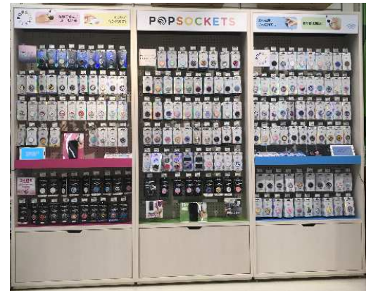
▲東急ハンズ新宿店