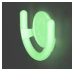
蓄光タイプは 暗闇でひかる！