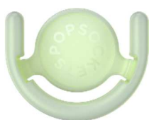
Glow in the dark