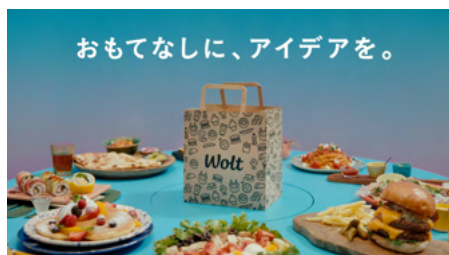
おもてなしに、アイデアを。