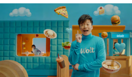
田中さん「確かに…あっ！！」