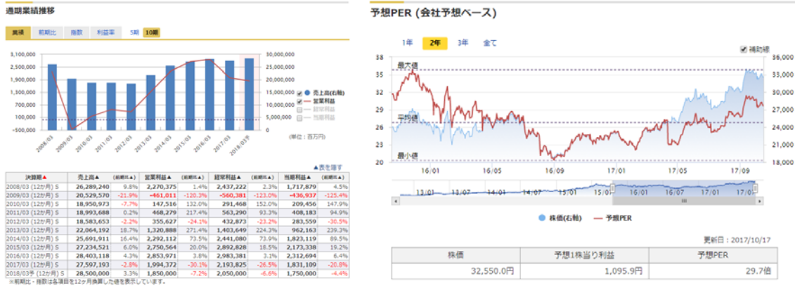
◀「マネックス銘柄スカウター」画面イメージ①：長期間の業績や株価指標▶

最長10年間の企業業績（売上高、営業利益、経常利益、当期純利益など）や最長5年間の各種株価指標（PER、PBR、配当利回りなど）をグラフで表示します。長期間の推移を視覚的に確認できるため企業の成長性やバリュエーションを判断する際に便利です。