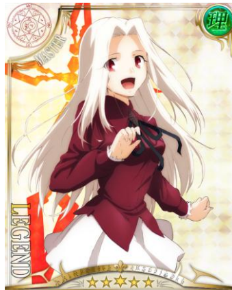
[希望を背に]アイリスフィール