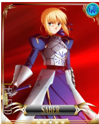
[故国が為]セイバー