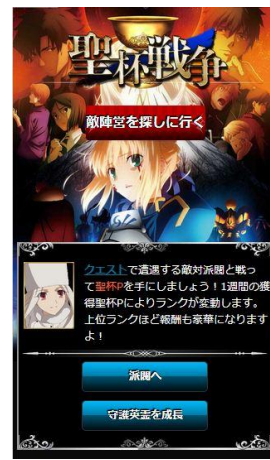
聖杯戦争 TOP ページ