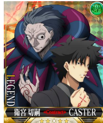
[対象感知]切嗣×キャスター