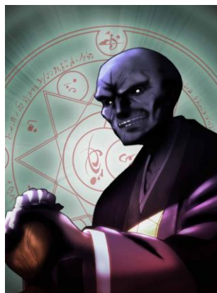
間桐臓硯 始まりの御三家 間桐家の当主