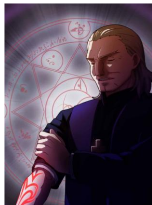
言峰璃正 言峰綺礼の父