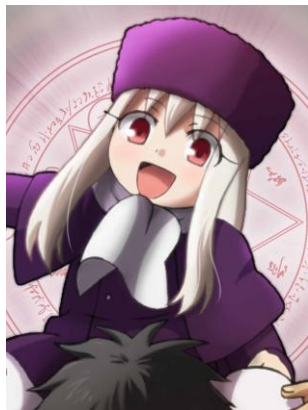
イリヤスフィール・フォン・アインツベルン 衛宮切嗣とアイリスフィールの娘