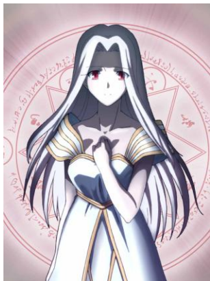
アイリスフィール・フォン・アインツベルン 衛宮切嗣の妻