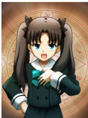
遠坂凜 遠坂時臣の娘