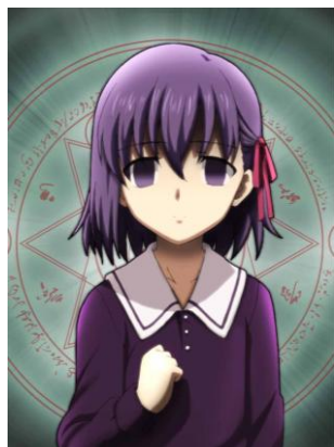
間桐桜 遠坂時臣の娘