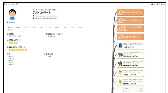
個人の社内外のつながりが一目で把握可能