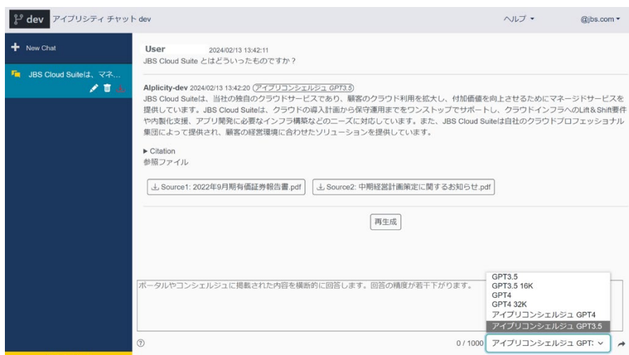
ユーザーインターフェイス

本サービスは、2023 年 4 月に JBS がリリースした、機密情報の漏洩リスクを回避して安心安全に AI チャットを利用できるサービス「 アイプリシティ チャット Powered by ChatGPT（以下、アイプリシティ チャット） 」のオプションサービスとなり、ブラウザベースのアイプリシティ チャットを介してプロンプト入力～回答生成までを行います。