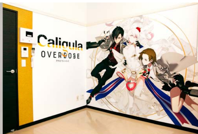
【イメージボードを印刷した壁紙】

また、本コラボを記念し、「お部屋ライブペイント」実施期間中にレオパレス 21 の店舗に来店した方へ、カリギュラ出演声優のサイン色紙が当たるプレゼントキャンペーンを実施。その他にも、“コラボ部屋”の様子を伝える生放送番組や、完成した作品を実際にご覧いただける“コラボ部屋”お部屋見学会などの取り組みを企画中です。