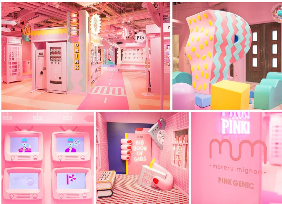
『morelu mignon』舞浜イクスピアリ店

『morelu mignon』舞浜イクスピアリ店は、“特別なゲストになれる街”をコンセプトに、店舗装飾やサービスを展開するプリ機専門店です。フォトジェニックな世界観の中でプリ撮影や記念撮影をお楽しみいただけます。