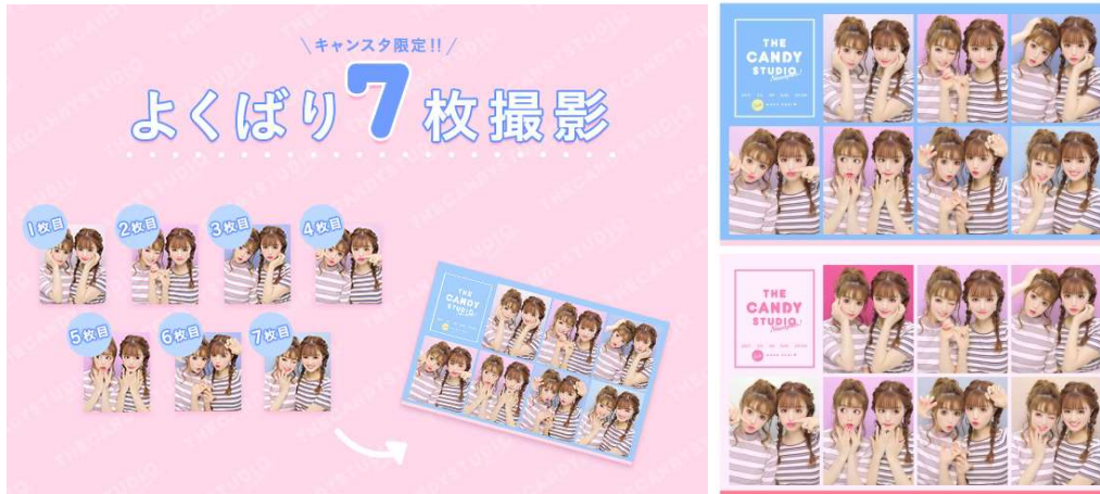
シール完成イメージ

*…フリユアのプリ機で撮影した画像の取得・閲覧サービス『PICTLINK』への有料会員登録が必要です。