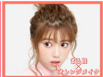
「テイストチェンジ」機能 仕上がりイメージ