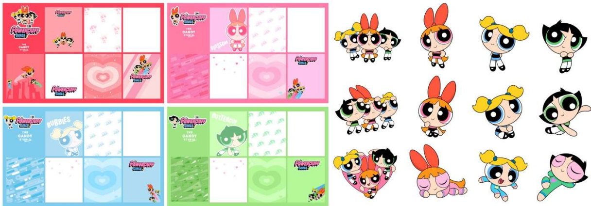
コラボ撮影フレーム・スタンプ一例

※キャンペーン開催期間および、参加方法等は店舗により異なります。予めご了承ください。