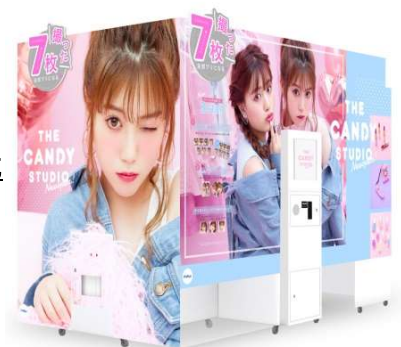
プリ機『THECANDYSTUDIO』外観イメージ