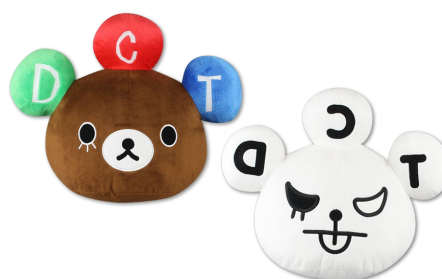
フェイスクッション (全2種/約35cm)