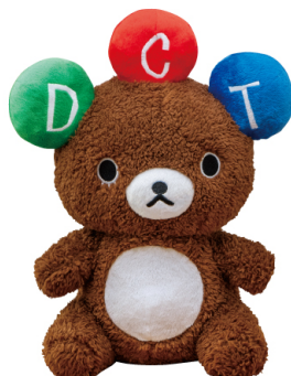
ドリカム超BIGぬいぐるみ (全1種/約70cm)