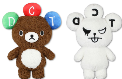
BIGぬいぐるみ (全2種/約35cm)