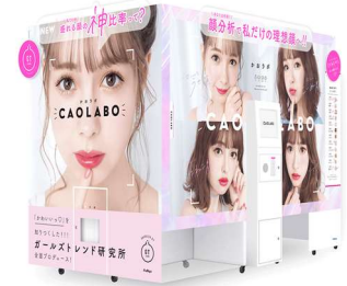
プリ機『CAOLABO』外観イメージ

https://www.puri.furyu.jp/allnews/op/caolabo_20200625/ >>