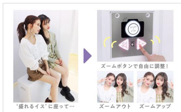
盛れ感をアップさせる『盛れる椅子』とズーム機能を搭載した新撮影