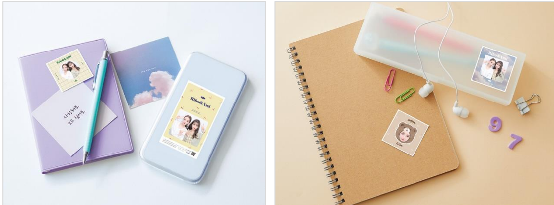
新レイアウト『プリトレカ』『プリンス』の活用方法

新シールレイアウトとして、SNSを中心に流行っているトレーディングカード風デザインの『プリトレカ』と自作ステッカー「インス」をイメージした正方形型の『プリンス』を搭載します。『プリトレカ』・『プリンス』は、レイアウトするプリの形をハートや丸から選んだり、ふちの色・柄を選んだりと自由にカスタムすることができ、世界で1枚だけのオリジナルシールが完成。さらに、『プリンス』では、撮影者の顔がアップになる1人用のデザインもご用意します。