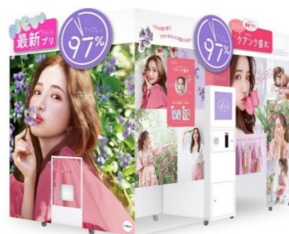
プリ機『97%』外観イメージ