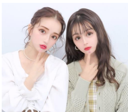
-3%の抜け感でつくる“クアंक盛れ”な写り