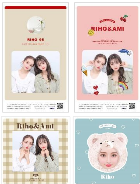
『プリトレカ』(上)、『プリンス』(下)イメージ

また、お好みの英数字を印刷できるため、自身の名前・ニックネームや記念日などを入れて思い出を可愛く残していただくことも。印刷したシールは、スマートフォンケースに挟んだり、筆箱やノートなどの文房具に貼ってお楽しみいただける他、アイドルやキャラクターなどご自身の“推し”の名前を入れるなど“オタ活(意味:ファン活動)”にもぴったりのデザインとなっております。