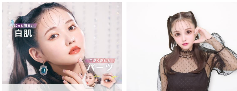
『Chaile』写りイメージとプリ画。ぱっと目を惹く“究極の美白盛れ”

『Chaile』は、透き通るように白いくっきりとした肌に、丸みのある目、ふんわりと優しい顔の輪郭にこだわった写りが特徴。プリのトレンドである白肌と丸みのあるパーツで“究極の美肌盛れ”を叶える他、5つの世界観とも相性抜群です。