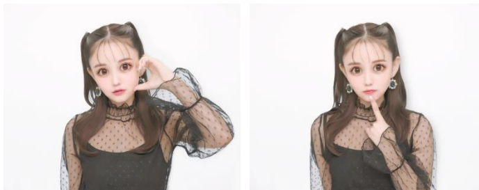
こだわりの美白盛れが特徴の『Chaile』プリ画イメージ