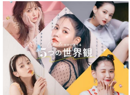
画像左上「スイートガール」、右上「モードガール」、中央「トレンドガール」、左下「コリアンガール」、右下「レトロポップガール」

世界観メイク: ミスティグレーのアイカラー×テラコッタリップで、美肌美人な憧れメイク シールデザイン: モチーフや色合いがまさにイマドキかわいいデザイン