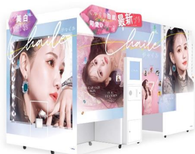
プリ機『Chaile』外観イメージ