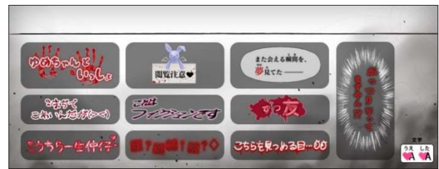
ホラーコース「ゆめちゃんといっしょ」のホラー要素が詰まったメイク・スタンプ機能