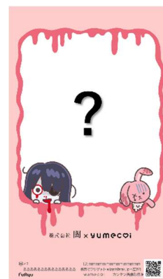
左：ホラーの落書きを施したプリ画イメージ