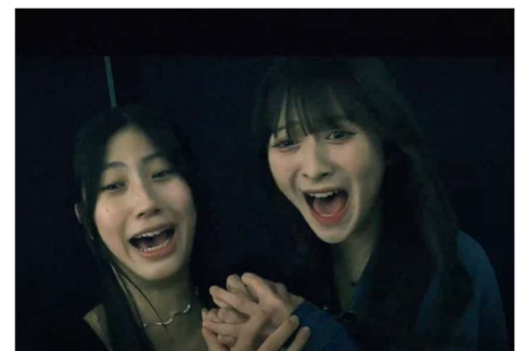
ホラーコース「ゆめちゃんといっしょ」で撮影している様子

*…「ゆめちゃんといっしょ」非搭載の『yumecoi』もございます。事前に店舗様へご確認ください。