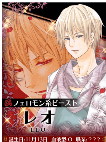
◆天然小悪魔セレブ レオ(29)