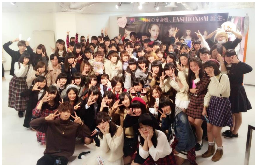
参加者との記念撮影