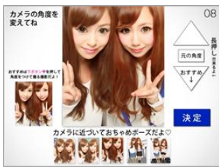
『R』カメラ角度調整画面イメージ