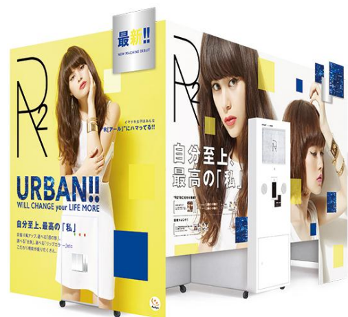
プリントシール機『R2』本体イメージ