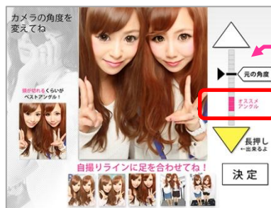
『R2』カメラ角度調整画面イメージ

目盛を見ながらカメラの位置を上下に移動させることが可能 “オススメアングル”の表示 スマートフォンで自撮りしたように(上目使いで小顔に)写る『R2』おすすめの角度を表示