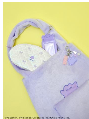
アイテムイメージ