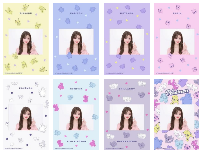
ヨコ画角のデザイン全 8 種類