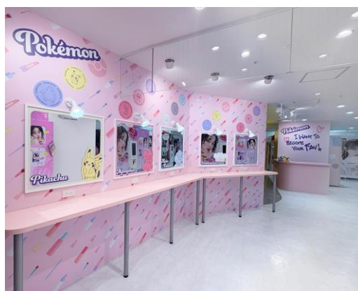
『girls mignon』SHIBUYA109 店 店内イメージ