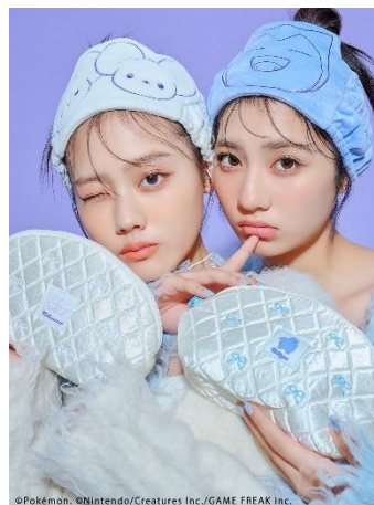
アイテムイメージ