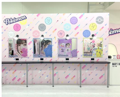
『girls mignon』名古屋オアシス 21 店 店内イメージ