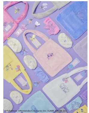
店舗・プリ・プライズでポケモンのデザインを同時期展開！

今回の取り組みのコンセプトは、「I WANT TO BECOME YOUR FAV」。デザインには、ピカチュウ、プリン、カビゴン、アローラロコン、ニンフィア、メタモン、チラーミィ、ワッカネズミが登場し、“メイク”をテーマにしたデザインを3つのコンテンツで展開します。パステルカラーを基調にトレンドの要素を取り入れたフリーならではのオシャレな空間に、是非ご注目ください。