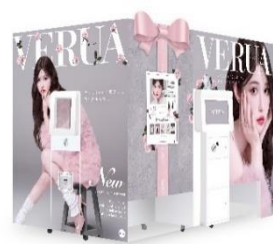
プリ機『VERUA』はこの外装が目印