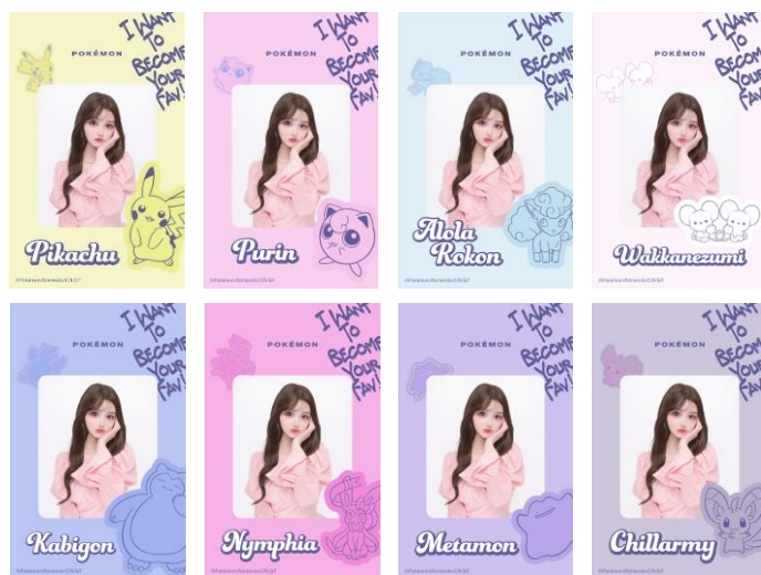
タテ画角のデザイン全 8 種類