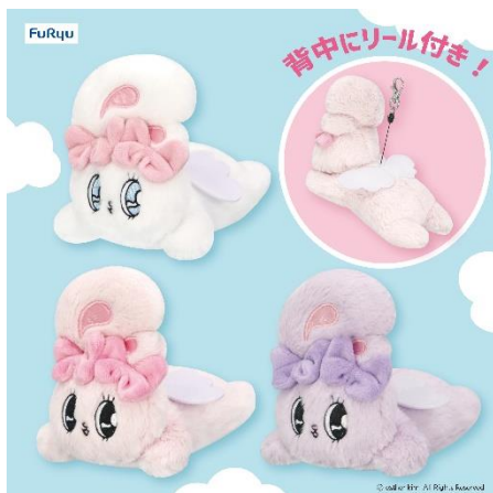
「エスターバニー エンジェルバスケット」 (全3種/約18cm)