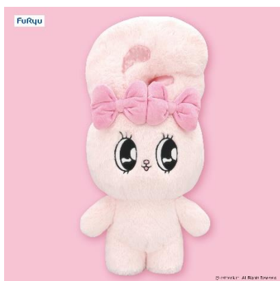
「エスターバニー 超BIGぬいぐるみ」 (全1種/約42cm)