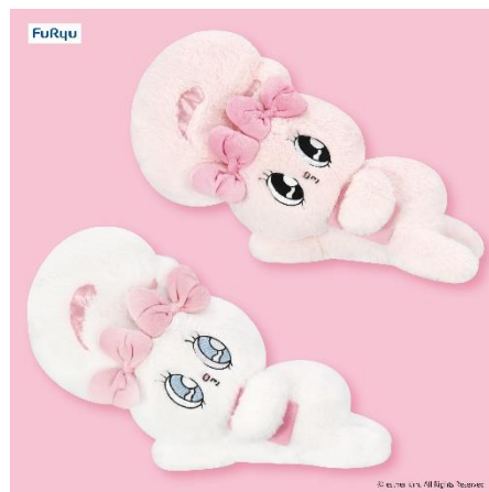
「エスターバニー 寝そべりBIGぬいぐるみ」 (全2種/約38cm)

1月には、「エンジェルバスケット」が登場します。天使の羽がついたデザインで、バッグに付けると「エスターバニー」がふわふわと飛んでいるように見えるのがポイント。背中には伸縮可能なリールがついているためバッグにつけたままバスケットとして使用することもでき、使い勝手も抜群です。また、「寝そべりBIGぬいぐるみ」は“お部屋に置くぬいぐるみは大きいものがうれしい”“ぬいぐるみはベッドに並べている”といった女の子の声から生まれたアイテム。「エスターバニー」がスマートフォンを見ながら寝そべっている姿が可愛らしく、ベッドサイドに置けばまるで添い寝をしているような気分にも。