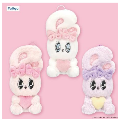
「エスターバニー ハートハグマスコット」 (全3種/約16cm)