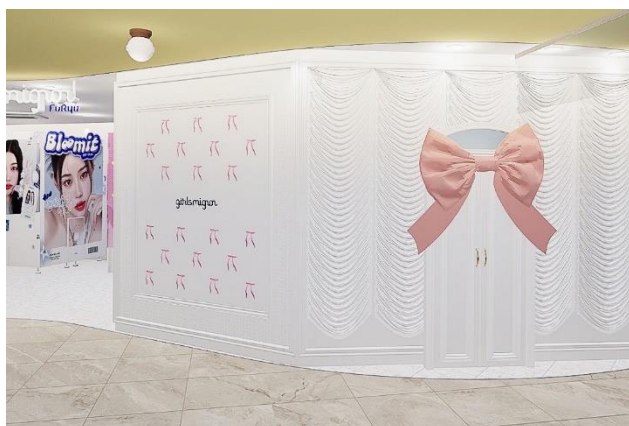
メインオブジェとなる店舗入り口の大きなリボン