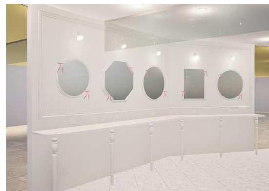
リボンを垂らした鏡が可愛いメイクアップカウンター