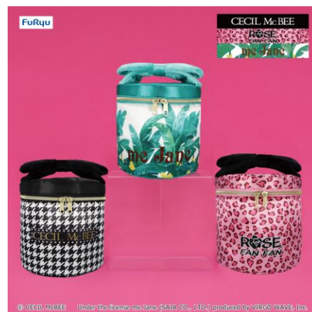
パニティポーチ (全3種類)

2月は、「me Jane」のブランドロゴTを着たくまのアイテムが登場します。「ブランドロゴT BIGぬいぐるみ」は柔らかな色合いと抜群の抱き心地が魅力です。「ブランドロゴTマスコット」はバッグに付けやすいサイズ感で、優しいナチュラルなデザインがポイント。また、「CECIL McBEE」「me Jane」「ROSE FAN FAN」の3ブランドそれぞれの「尻尾チャーム」は、当時バッグに付けていた懐かしのデザインを再現しており、平成ギャルの心をくすぐるアイテムです。ブランドを象徴するデザインの「パニティポーチ」は、大きめのマチ付きでコスメや小物をすっきり収納できます。