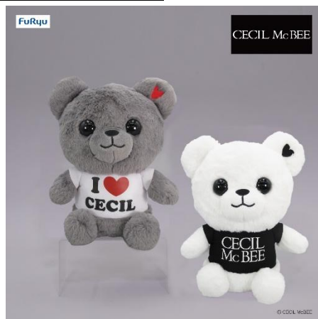
セシルベア BIG めいぐるみ (全 2 種類)