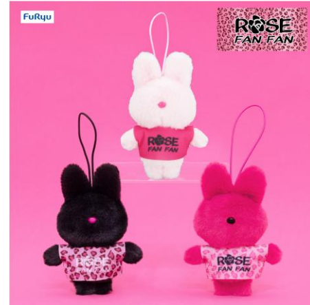
ブランドロゴ T マスコット (全 3 種類)