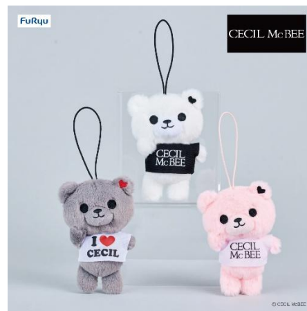
セシルベアマスコット (全 3 種類)