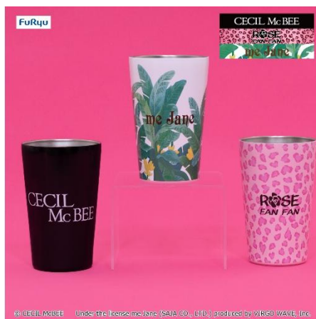
ステンレスタンブラー (全 2 種類)