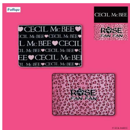
ブランドロゴ毛布 (全 2 種類)