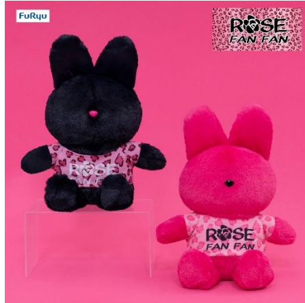
ブランドロゴ T BIG ぬいぐるみ (全 2 種類)