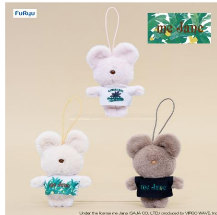
ブランドロゴ T マスコット (全3種類)