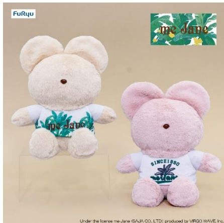
ブランドロゴ T BIGぬいぐるみ (全2種類)