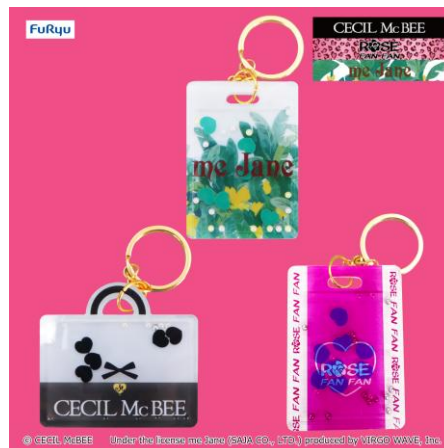
ショッパー風シャカシャカアクリルチャーム (全 3 種類)