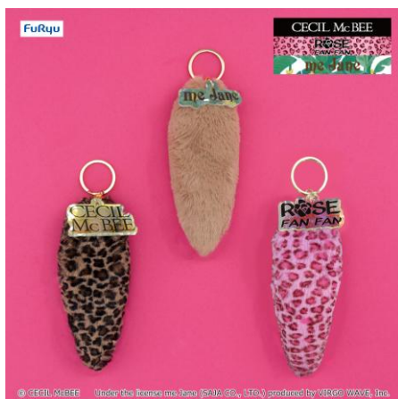
尻尾チャーム (全3種類)