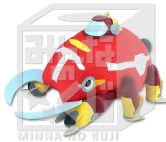
B賞:クワガタンぬいぐるみ (全1種/全長約40cm)