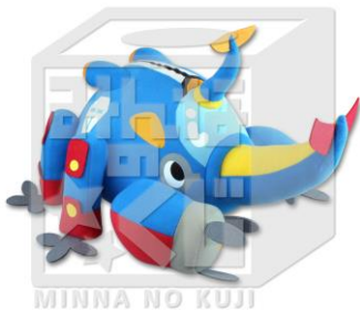
A賞:メカブトンぬいぐるみ (全1種/全長約40cm)