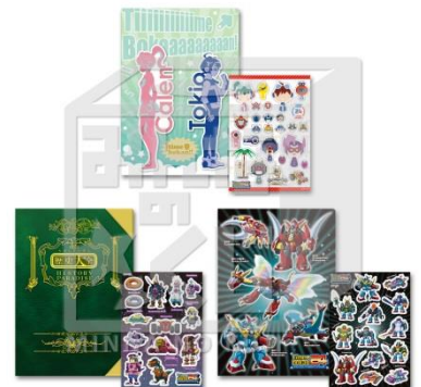
F賞:ノート&ステッカー (全3種/ノート:A4サイズ、 ステッカー:A5サイズ) ※いずれか1セットになります。