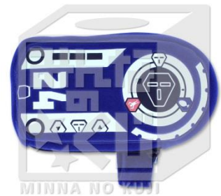
C賞:ボカンプレスポーチ (全1種/約15cm)