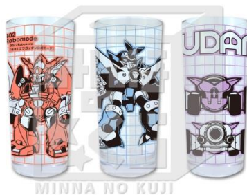
E賞:グラス (全3種/全高約12cm) ※いずれか1つになります。