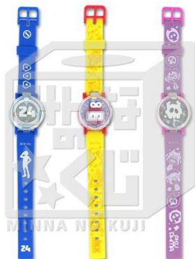
D賞:リストウォッチ (全3種/約21cm) ※いずれか1つになります。