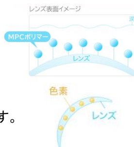
ブルーセントリーフ