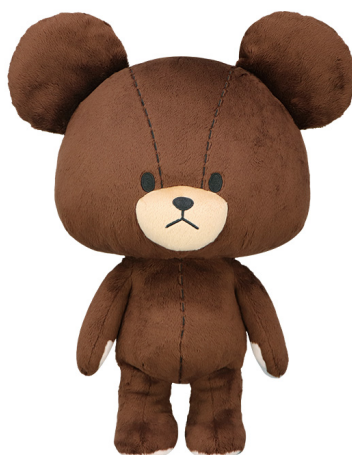
超BIGぬいぐるみ (約50cm、全1種)