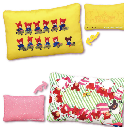
プリントクッション (約45×30cm、全2種)