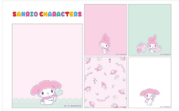
「マイメロディ」セット