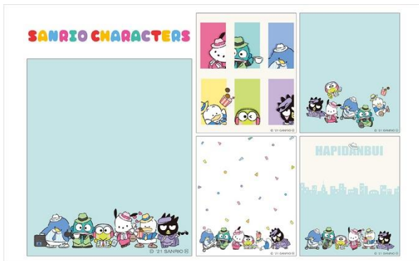
「はぴだんぶい」セット