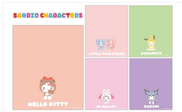
「サンリオキャラクターズ」セット