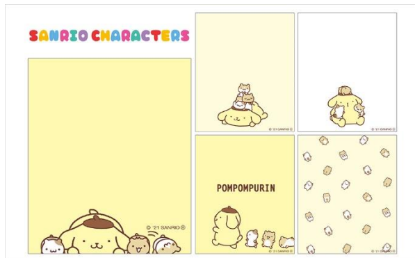
「ポムポムプリン」セット