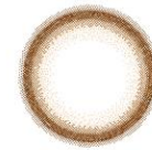
caramel brown キャラメルブラウン

全5種類のレンズラインナップからお気に入りを見つけてもらいやすくするための少枚数6枚入り。