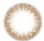
cherie brown シェリブラウン