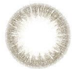
calm olive カームオリーブ