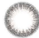
uruful black ウルフルブラック