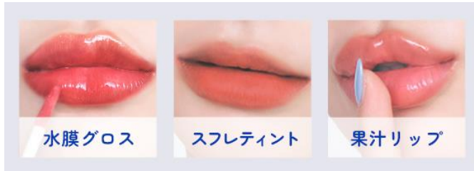
計 30 通りの組み合わせで なりたいたいイメージに近づける「リップテイスト」

「ポイントアイメイク」では、目を自然に大きく見せる“目尻ライン”、目頭に光をのせ華やかさを演出する“つぶハイライト”、目頭から黒目にかけてアイラインを追加し目ヂカラをアップさせる“くの字ライン”をご用意。いずれも若年女性を中心にトレンドになっているメイクで、使用することで“今っぽさ”をプラスしあか抜けた印象に仕上がります。この他にも、片目ずつ調整が可能な「目の大きさ」や「涙ぶくろ」なども新たに追加され、より細かな部分まで自分好みの“盛れ感”に仕上げただけできるようになりました。