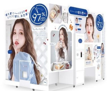
プリ機『キューナナパーセント2』外観イメージ