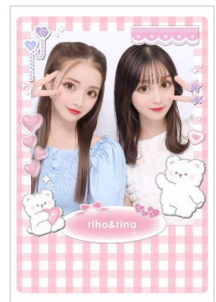
“今っぽ可愛い”をテーマにパワーアップした 『キューナナパーセント2』のプリ画・シール(「デコトレカ」)仕上がりイメージ

『キューナナパーセント2』は、目の大きさや輪郭などのバランスを見直した“新・クアंक盛れ”な写りが最大の特徴。『キューナナ』らしい“-3%の抜け感”は保ったまま、より一層“盛れ感”を強く感じられるようになりました。また、トレカデコ風デザインが可愛い「デコトレカ」レイアウトを新搭載。本レイアウトは、推しのトレーディングカード(以下、トレカ)をシールなどでデコレーションするトレカデコをイメージしたものです。韓国での流行をきっかけに日本の“推し活女子”の中でも話題を集めているトレンドアイテムをプリで手軽に楽しめるようになりました。