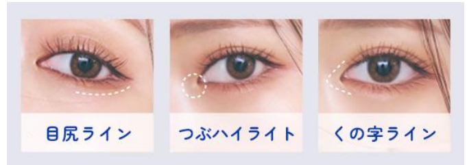
盛れ感をプラスする「ポイントアイメイク」で 好みの目元を演出できる