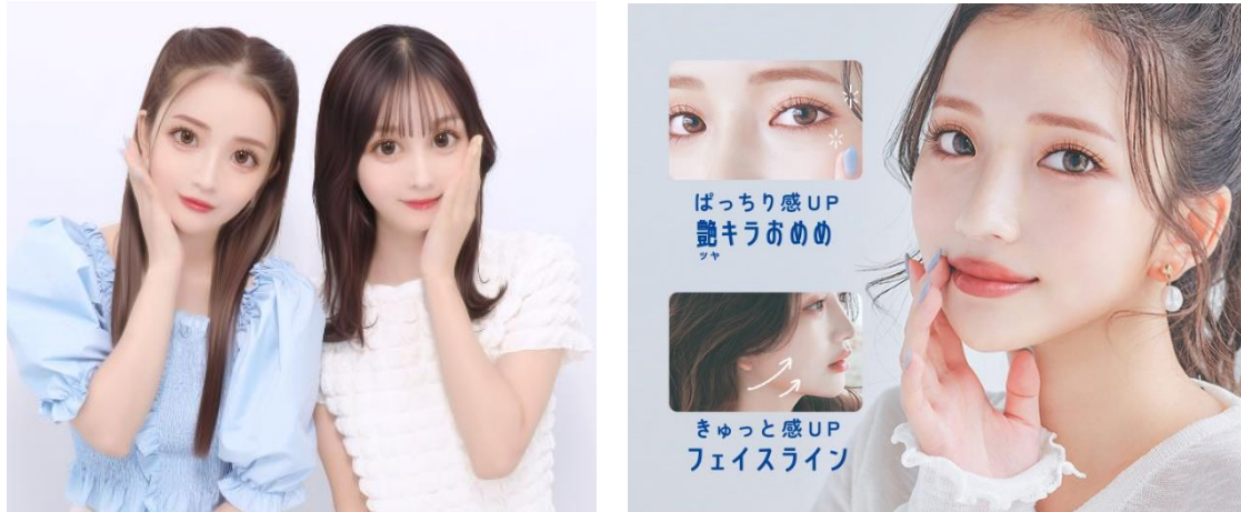
ユーザーの声を反映し盛れ感がアップした“新・クアंक盛れ”が楽しめる

『キューナナ』ファンから要望の多かった目の大きさと輪郭を見直し、しっかりとした盛れ感にパワーアップした“新・クアंक盛れ”が『キューナナパーセント 2』の写りの特徴。『キューナナ』らしい“-3%の抜け感”はキープしつつ、最新のプリの写りトレンドを反映した“今っぽ可愛い”仕上がりをお楽しみいただけます。