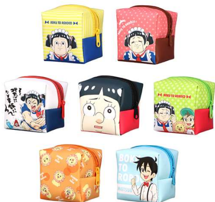
E賞: キューブポーチ (全 7 種 / 約 7 × 7cm) ※いずれか 1 つになります。