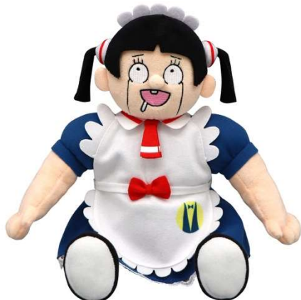
A賞:ロボコぬいぐるみ ほげ～Ver. (全1種/約25×25cm)