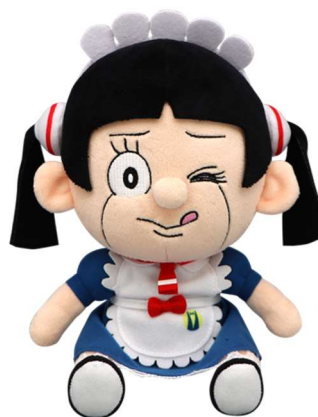
B賞:ロボコぬいぐるみ (全1種/約24×20cm)