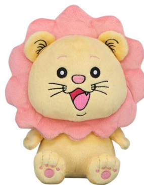
D賞: ニオンタぬいぐるみ (全 1 種 / 約 20 × 17cm)