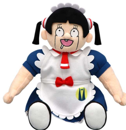
ダブルゲット賞: ロボコぬいぐるみ ほげ~Ver. (全 1 種 / 約 25 × 25cm)