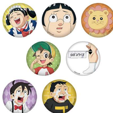
F賞: 缶バッジ (全 7 種 / 約 6.5cm) ※いずれか 1 つになります。