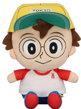
C賞: ボンドぬいぐるみ (全 1 種 / 約 20 × 15cm)